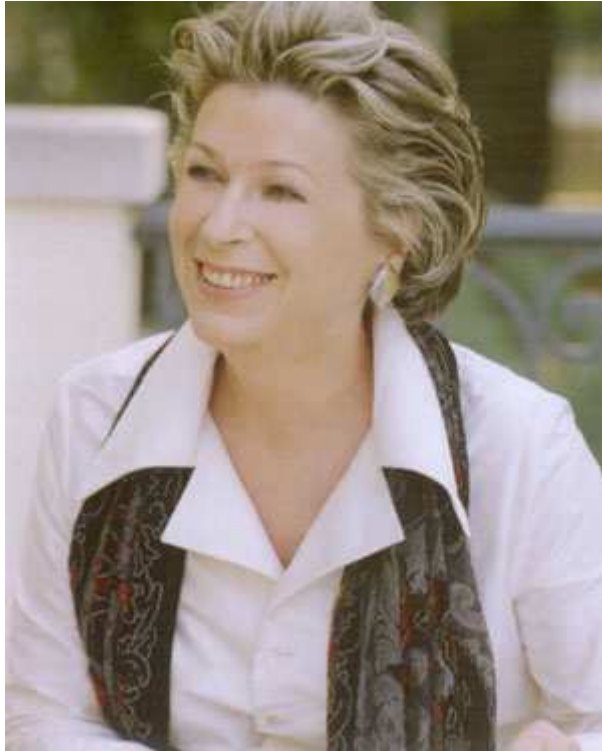
Irena Eris, jedna z najbardziej znanych polskich dam biznesu