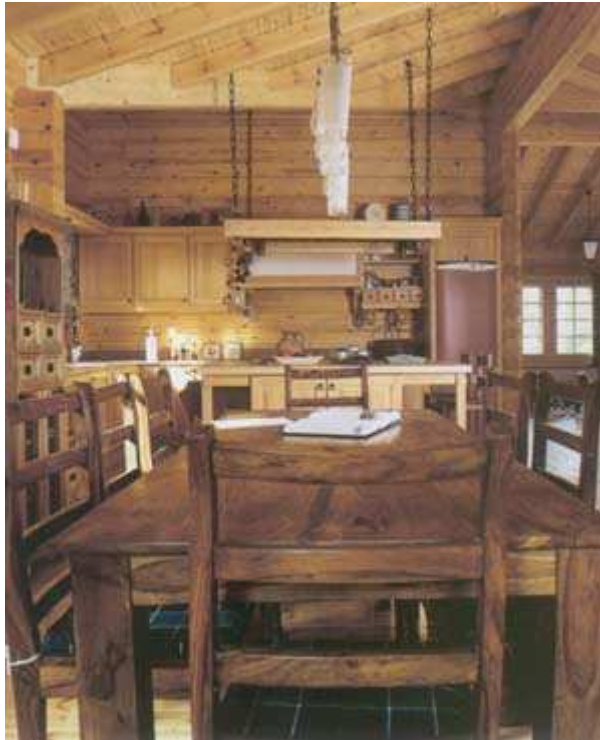
Przy dużym stole w jadali w weekendy zasiada cała rodzina - rodzice, dzieci i wnuki

harmonogram zajęć zawodowych, nie mogliśmy poświęcić dużo czasu na tworzenie nowego domu. Bez jej pomocy proces urządzania trwałby bardzo długo. Oczywiście, i ja i mąż wiedzieliśmy, czego chcemy. Dom miał być wygodny dla wszystkich członków rodziny. Po omówieniu całości projekt powierzyliśmy projektantce, która podsuwała nam gotowe rozwiązania do akceptacji. Współpraca była miła i łatwa dzięki zrozumieniu i zaangażowaniu obu stron.